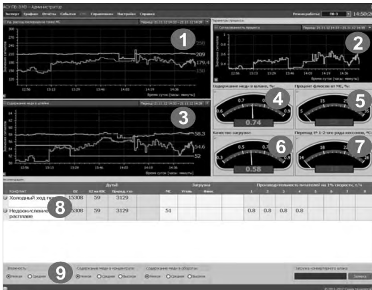
Рис. 1. Главная форма приложения ИАСУ ПВ-3 «Эксперт»

Главное окно ИАСУ ПВ-3 показано на рис. 1, где цифрами пронумерованы его составные части: